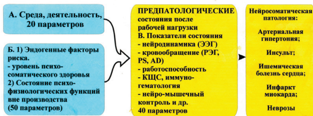
СХЕМА ИЗМЕНЕНИЙ ФУНКЦИОНАЛЬНОГО СОСТОЯНИЯ РАБОЧИХ ОПЕРАТОРОВ МЕТАЛЛУРГИЧЕСКОГО ПРЕДПРИЯТИЯ И ПОСТРОЕНИЕ МОДЕЛИ ВЛИЯНИЯ СРЕДЫ И ДЕЯТЕЛЬНОСТИ